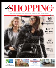
Texas y México

Actualmente tenemos una oficina en Texas y 9 oficinas localizadas en diferentes Ciudades de México. Contamos también con otras publicaciones como: México Industry y Somos Tamaulipas, entre otras.